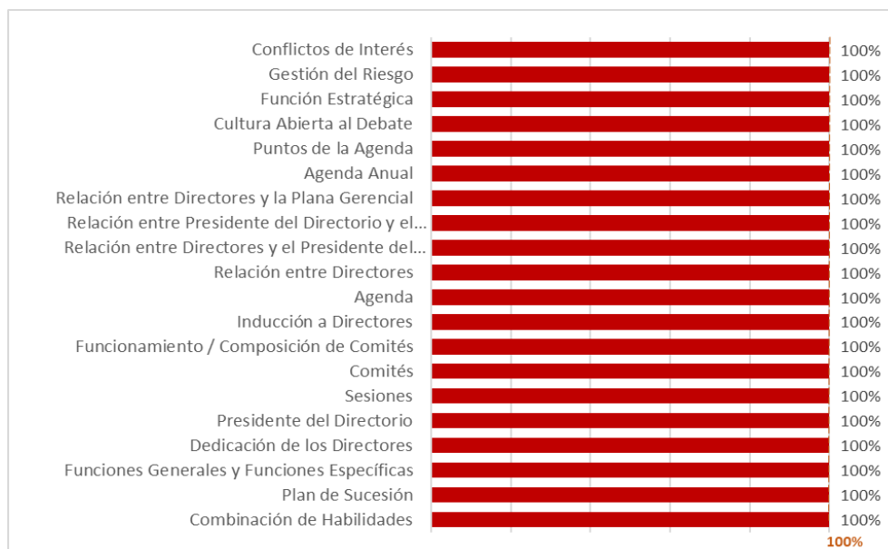
Gráfico N° 1: Autoevaluación del Directorio - Resultados por elemento

87%: Promedio obtenido a nivel de todas las empresas participantes para la Autoevaluación del Directorio.