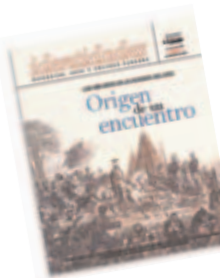
ILUSTRACIÓN DE PORTADA

El descubrimiento del Mississippi por De Soto (1888) , de William Powell, Rotonda del Capitolio de Estados Unidos.