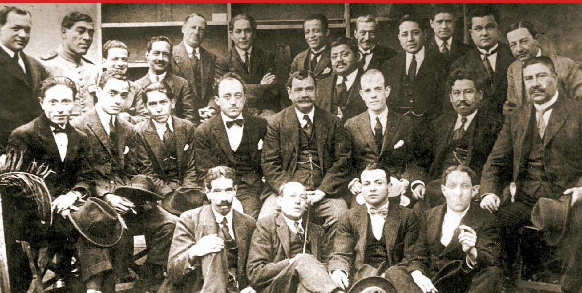
Redactores y periodistas de El Peruano, año 1922