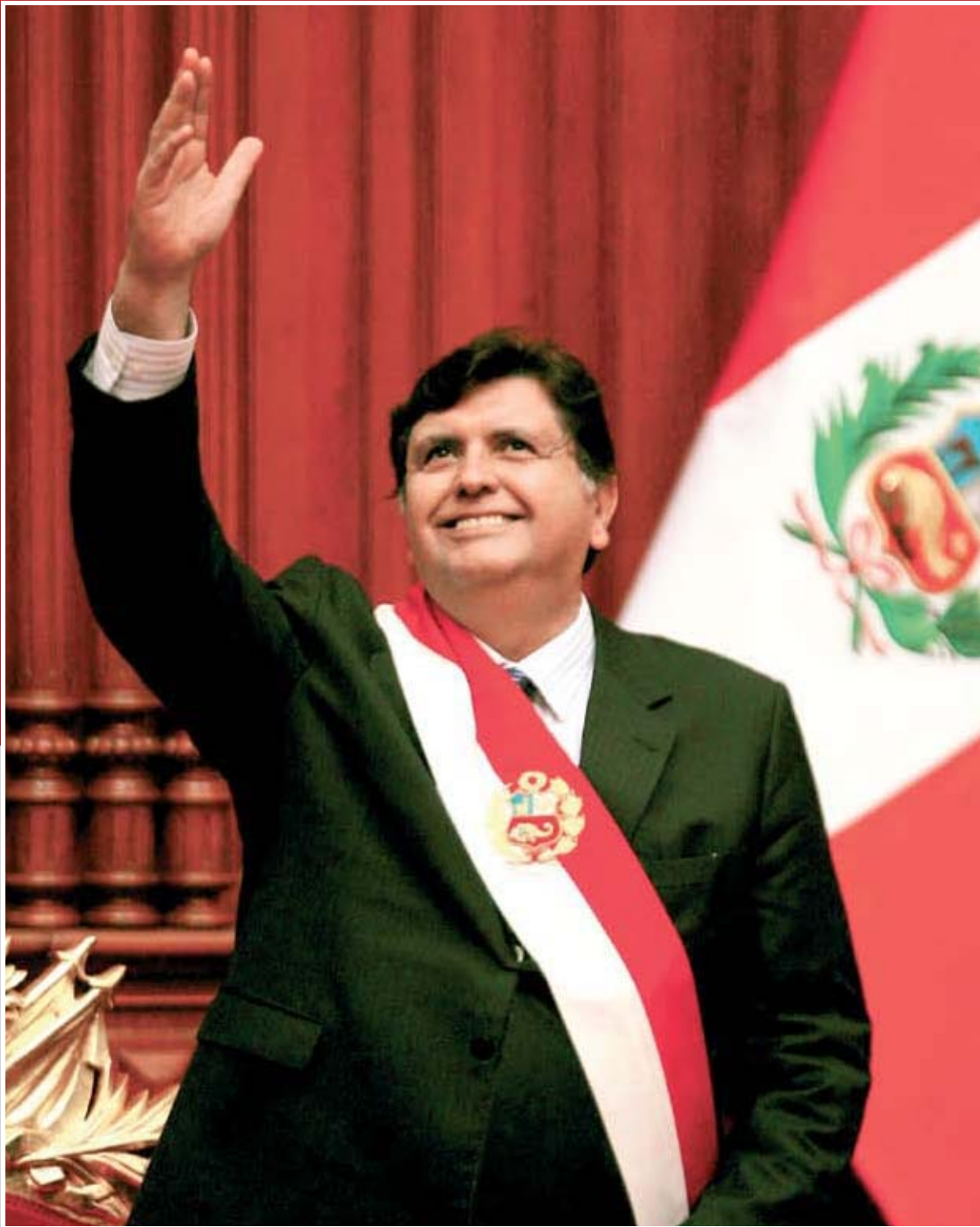
DR. ALAN GARCÍA PÉREZ Presidente Constitucional de la República del Perú

Art. 110 "El Presidente de la República es el Jefe del Estado y personifica a la Nación", a la cual nos debemos.