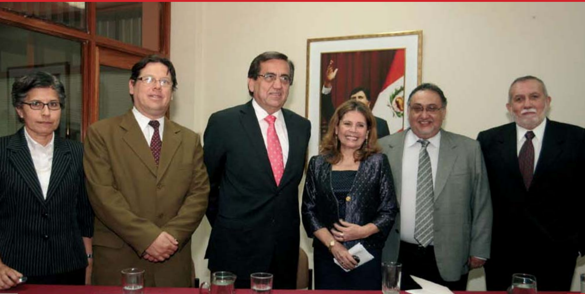
Reunión con el Director Ejecutivo de FONAFE y el Presidente del Consejo de Ministros