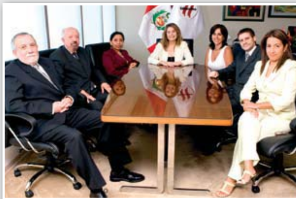
Nuestro Directorio con el Gerente General y la Secretaria Letrada.